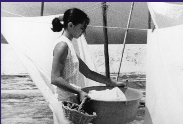
Uma pedra no bolso / 1987 / Portugalsko / Režie: Joaquim Pinto

Nabízí prostřednictvím sdílené bezplatné platformy kolekci evropských filmů obsahující vedle současných filmů také zásadní filmy evropského kulturního dědictví. Hned od spuštění CinEd nabízí na adrese www.cined.eu devět filmů, které vybírali odborníci na filmovou výchovu z partnerských zemí, jimž jsou Bulharsko, Česká republika, Francie, Itálie, Portugalsko, Rumunsko, Španělsko.