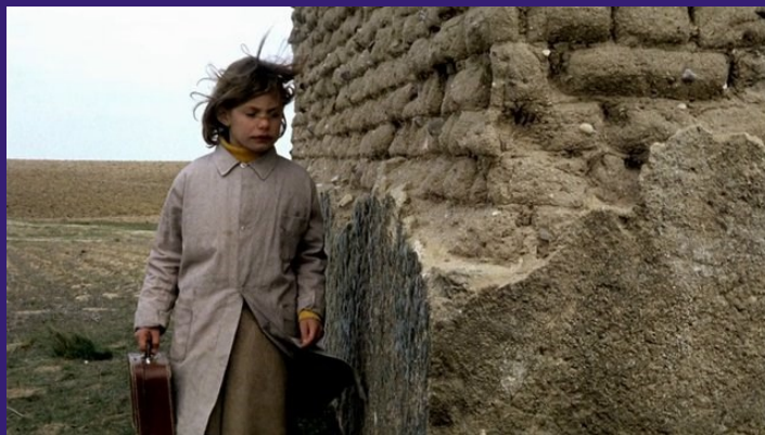
Duch úlu / Španělsko / 1973 / Režie: Victor Erice