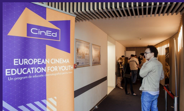
Program CinEd běží po celé Evropě

V nabídce platformy CinEd přibývají stále nové filmy, které jsou postupně otitulkovány do jazyka partnerského státu.