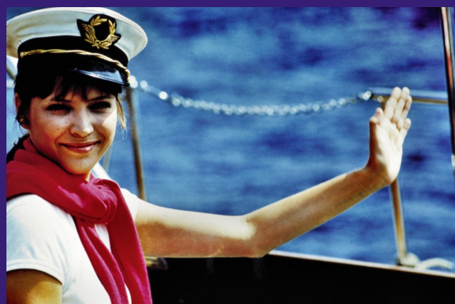
Bláznivý Petříček / Francie / 1965 / Režie: Jean-Luc Godard

Počet filmů se bude pro každý školní rok zvyšovat včetně zařazení českých filmů, které se v programu objeví ve školním roce 2017/2018. Filmy jsou vybírány s ohledem na zvyšování filmové gramotnosti žáků i studentů všech typů škol a jsou tudíž vhodné pro ZŠ prvního i druhého stupně, pro SŠ, VOŠ i univerzity.