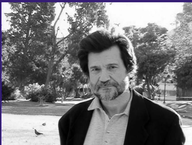
Režisér Victor Erice / Autor snímku Duch úlu

CinEd bude průběžně přijímat nové partnery z evropských zemí (ve školním roce 2016/2017 Finsko a Polsko) a také bude rozšiřovat katalog evropských filmů s cílem dále zvyšovat filmovou gramotnost mladých diváků.